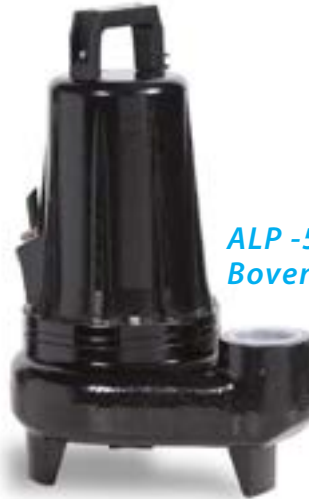
ALP -5 Boven aansluiting