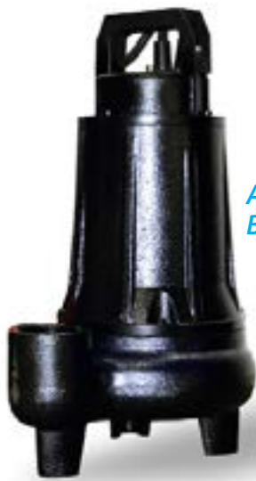
ALP 22-32-5 Boven aansluiting