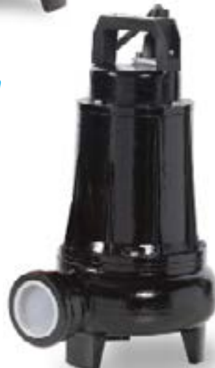
COM 22-32 Met zij aansluiting geschikt voor voetkoppeling met pompklauw voor geleider buis