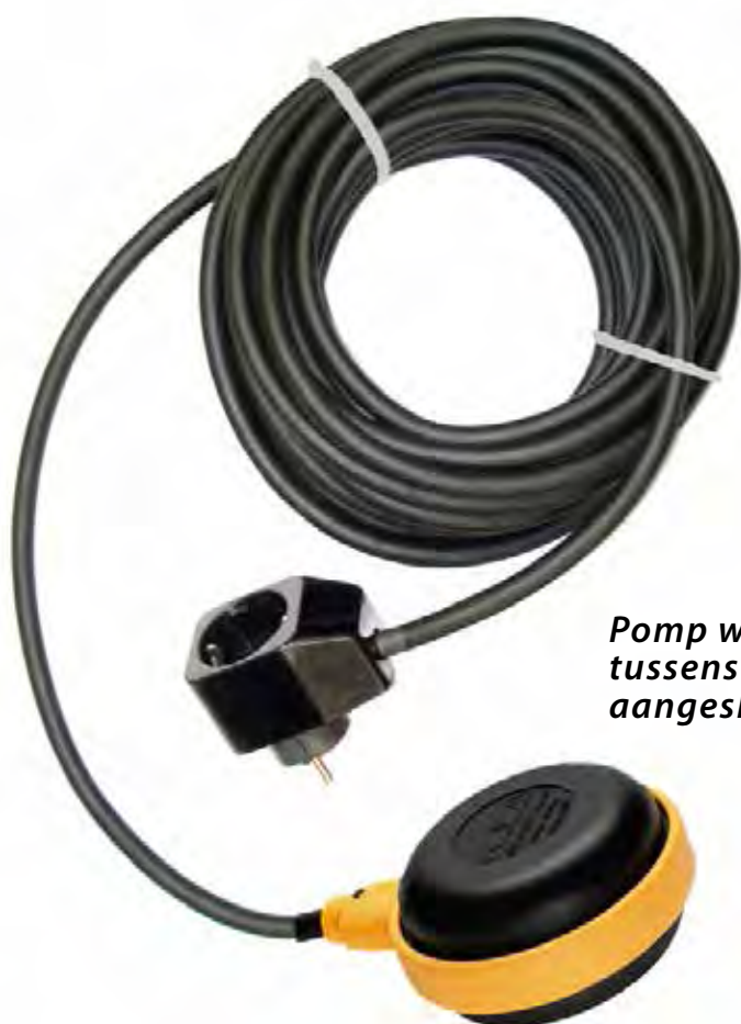
Pomp wordt aan de tussenstekker aangesloten